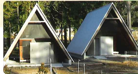
日本一きれいなキャンプ場のトイレを目指している、きれいなトイレです。

大きなお芋を掘りだした時の、お子さんの笑顔は最高でしょう。旧牛舎を改装した広場、大屋根ガーデンYAHHOでは、千葉の新鮮野菜を集めたマルシェやドリンクやアイスクリームが堪能できるミルクバースタンドが魅力的。トイレもとてもきれいで、気持ち良く使えます。日本一きれいなキャンプ場のトイレを目指しているそうです。